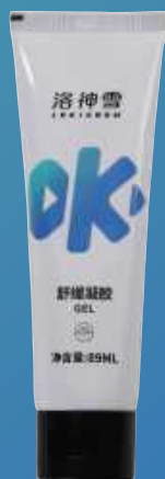
凝胶型 89ml 舒缓凝胶 GEL

涂抹 / 喷涂至肌肤不适处， 适当按摩效果更佳； 开放式伤口请勿使用， 孕妇及儿童使用请遵医嘱。